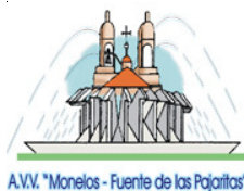
AVV. "Monelos - Fuente de las Pajaritas"