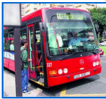
pulsa sobre la foto para descargar la información impresa sobre los cambios